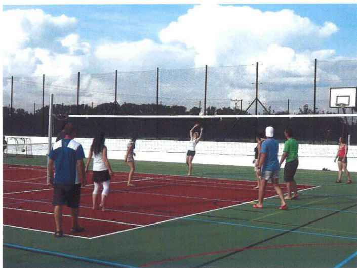
Hřiště je určeno pro mnoho druhů sportu