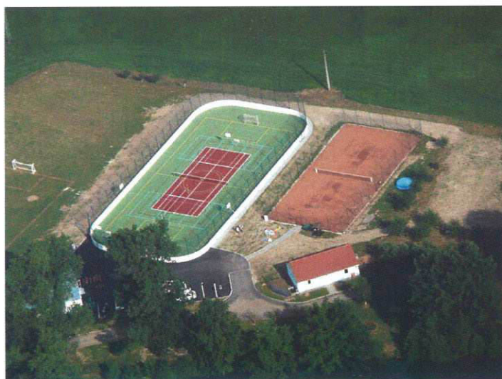
Sportovně rekreační areál v Čejeticích - letecký snímek