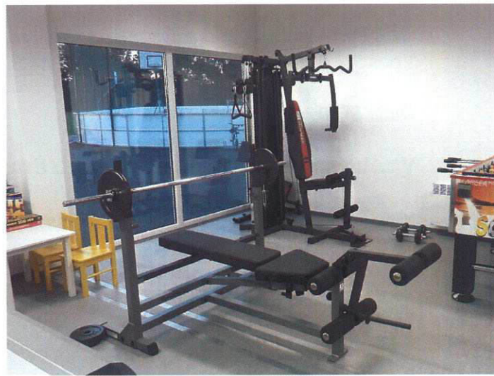
Zázemí pro indoorové aktivity