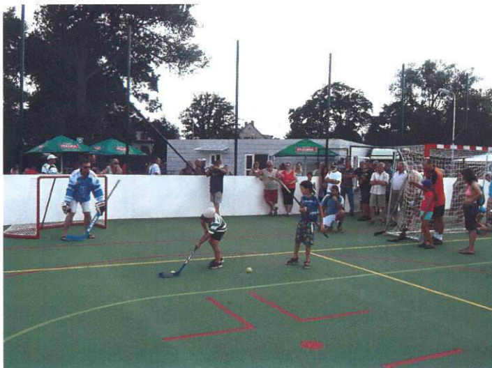
Otevření sportoviště zahájil hokejista - brankář Roman Turek, držitel Stanley Cupu